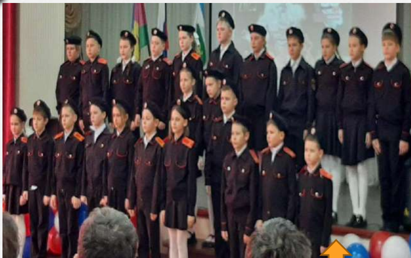
Конкурс военной песни