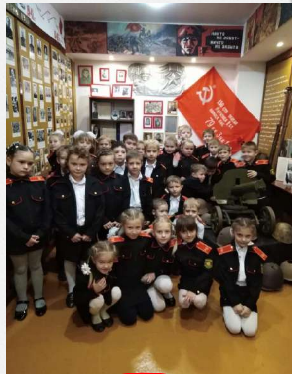
Посещение школьного музея имени Павлика Пищенко